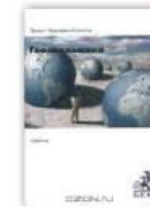
10. Геоэкономика (освоение мирового экономического пространства), Москва, 2002.