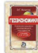
2. Геоэкономика (освоение мирового экономического пространства), Москва, 2011.