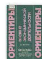
14. Ориентиры внешнеэкономической деятельности, Москва, 1992.