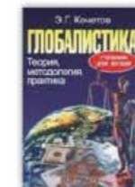
9. Глобалистика: теория, методология, практика, Москва, 2002.