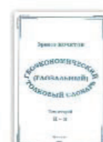
7. Геоэкономический (глобальный) толковый словарь. В 2-х томах, Т.2, Москва, 2002.