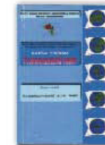
8. Геоэкономический атлас мира, Москва, 2002.