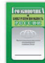
3. Геоэкономика и конкурентоспособность России, Москва, 2010.