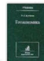
12. Геоэкономика (освоение мирового экономического пространства), Москва, 1999.