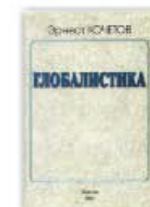
11. Глобалистика как геоэкономика, как реальность, как мироздание, Москва, 2001.