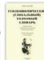
4. Геоэкономический (глобальный) толковый словарь, Екатеринбург, 2006.