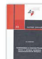
13. Геоэкономика и стратегия России, Москва, 1997.