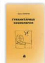
5. Гуманитарная космология, Москва, 2006.